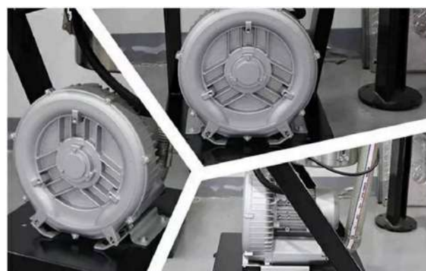
Separate - Vacuum hopper loader